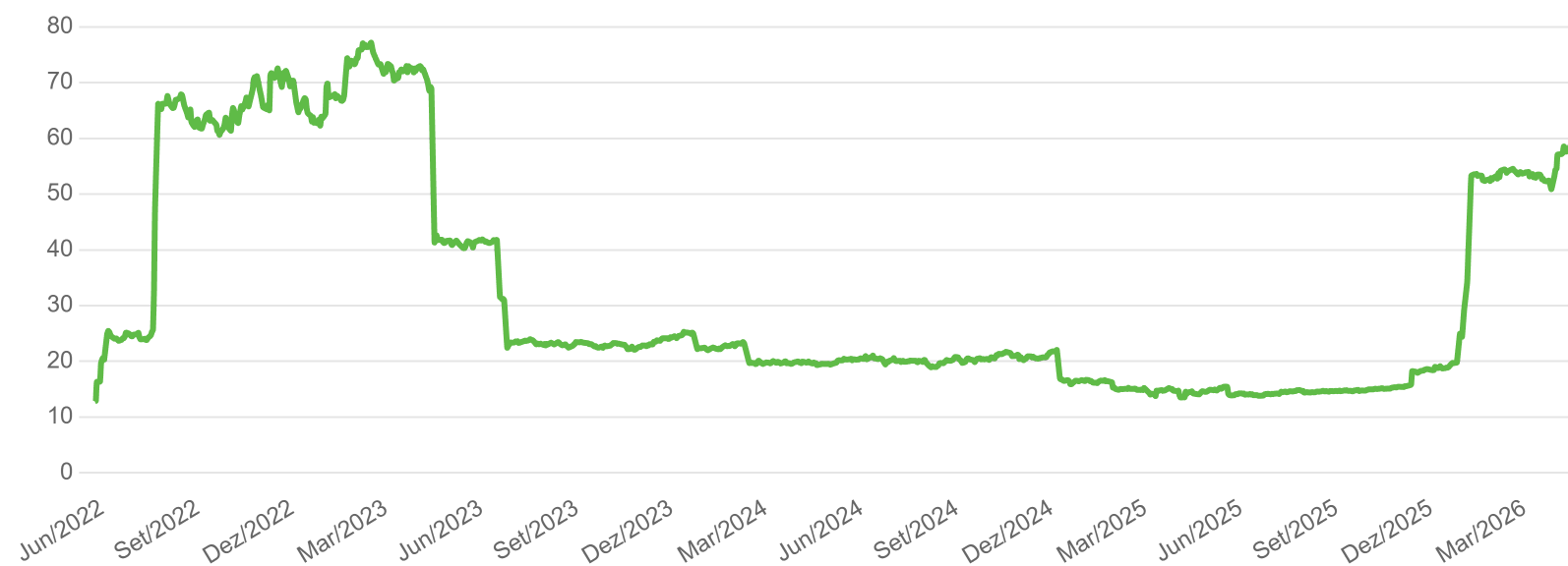
Evolução AuM (R$ Milhões)